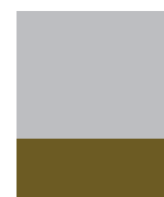
1/3 pág. horizontal Sangre 204 x 90 Caja 171 x 76