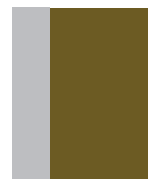
3/4 página Sangre 151 x 272 Caja 128 x 230