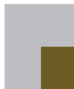
1/4 de página Sangre 100 x 134 Caja 84 x 113