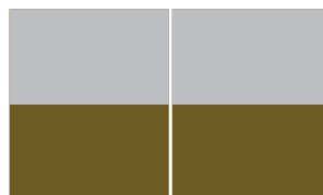
Doble 1/2 página horizontal Sangre 408 x 134 Caja 370 x 113