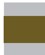
1/2 pág. central Sangre 204 x 134 Caja 171 x 113