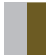
1/2 página Sangre 100 x 272 Caja 84 x 230