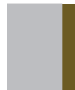
1/4 pág. vertical Sangre 49 x 272 Caja 41 x 230