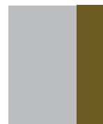
1/3 pág. vertical Sangre 68 x 272 Caja 57 x 230